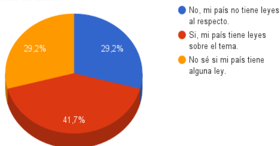
¿Su país tiene alguna ley que permita que las bibliotecas realicen reproducción de obras digitales sin pedir permiso al titular del derecho de autor?

Asimismo, a la pregunta ¿Su país tiene alguna ley que permita que las bibliotecas realicen suministro de obras digitales sin pedir permiso al titular del derecho de autor?, un 54.2% no sabe si existe regulación relacionada al tema, el 25% asegura que en El Salvador no existe este tipo de ley.