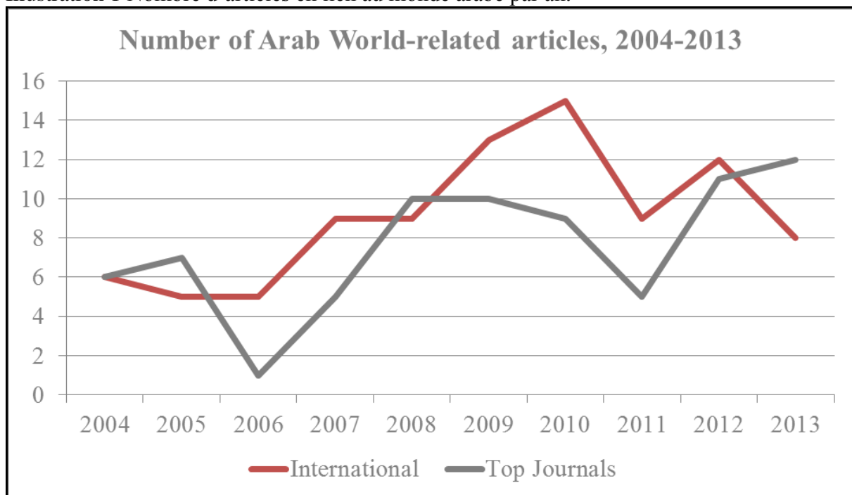
Illustration 1 Nombre d'articles en lien au monde arabe par an.