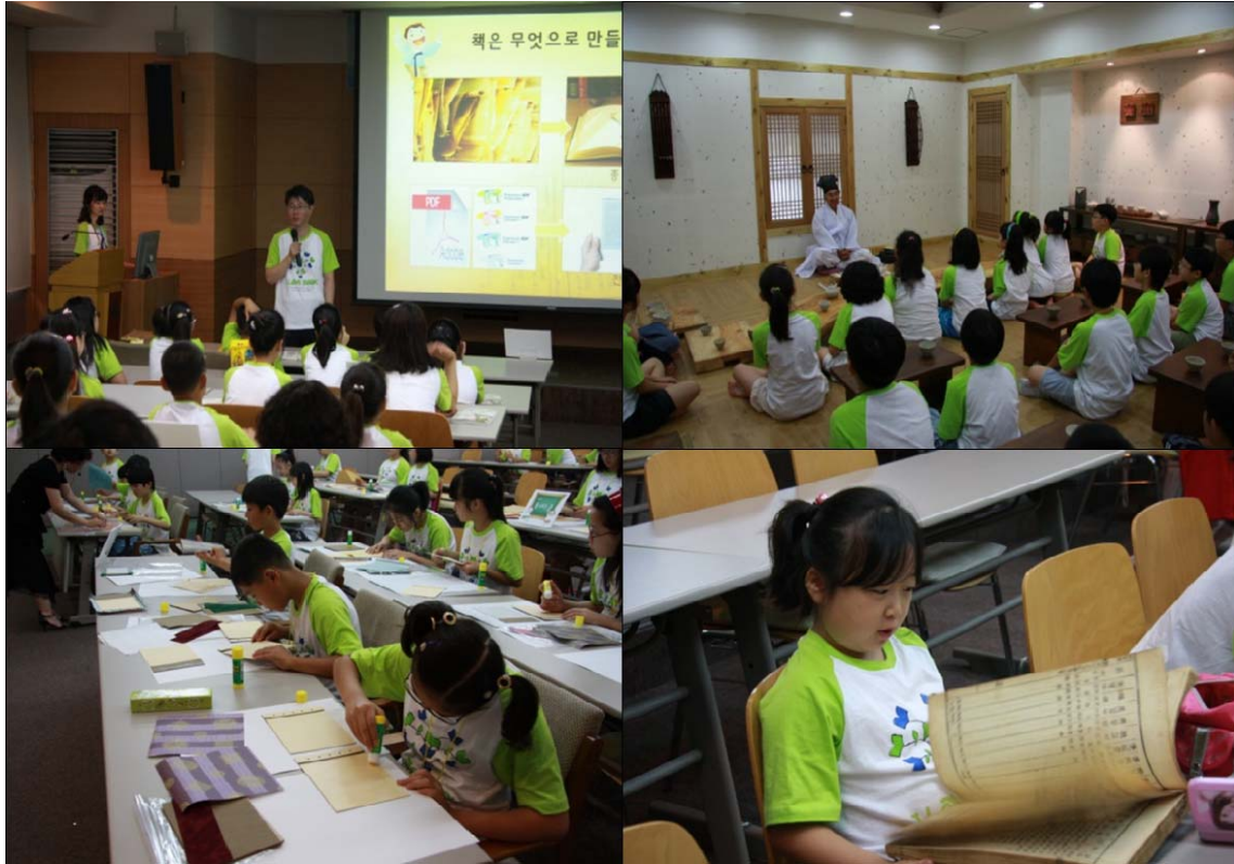
<Les enfants de participer la classe d'été font de la généalogie après l'enseignement.>