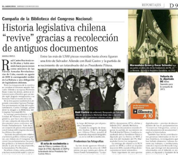
Imagen 2: El Mercurio, Cuerpo D 9, 31 de mayo de 2015

3º Difusión en los medios de comunicación masivos: Al lanzar la campaña de difusión se prefirió hacerlo internamente en el propio portal de la Biblioteca del Congreso Nacional de Chile ( http://www.bcn.cl/noticias/donaciones-bcn ), lo que a su vez fue difundido por las redes sociales de la BCN. Luego, se envió un correo electrónico a los principales medios de comunicación tanto de Santiago de Chile como de las otras regiones chilenas, el que tuvo acogida en diario de circulación nacional más importante de Chile, el que destacó la iniciativa con una publicación del 31 de mayo de 2015, la que tituló Historia legislativa chilena “revive” gracias a recolección de antiguos documentos .