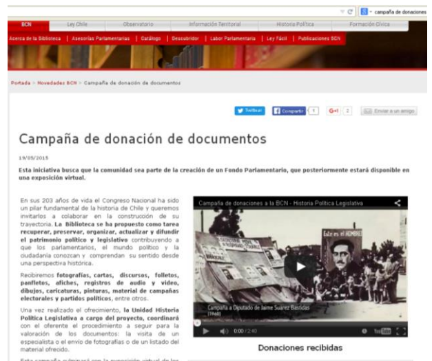
Imagen 3: Portal web de la BCN de Chile